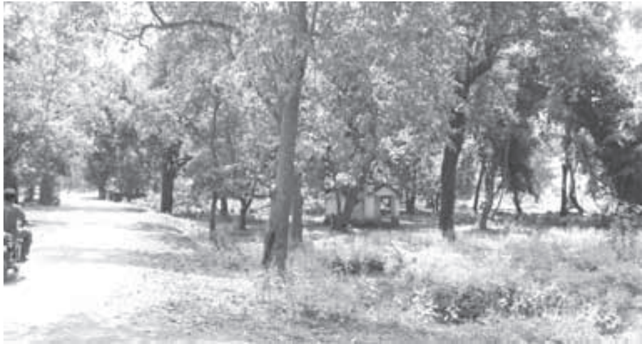
ନବରଙ୍ଗପୁର ଜିଲ୍ଲା ଝରିଗାଁରେ ଥିବା ଧର୍ମୀୟ ବନ ସତ୍ତ୍ୱେ ନିର୍ମାଣ ଦ୍ୱାରା ସଂକୁଚିତ ହେବାର ଦୃଶ୍ୟ

ଧର୍ମୀୟ ବନ କେତେକ ସ୍ଥାନରେ ବାହ୍ୟ ପ୍ରଭାବରୁ ବର୍ତ୍ତମାନ ମୁକ୍ତ ଥିଲେ ମଧ୍ୟ ତାହା ଯେ ଭବିଷ୍ୟତରେ ବିପଦଗ୍ରସ୍ତ ହେବନାହିଁ, ତାହା କୁହାଯାଇପାରିବନାହିଁ । ବର୍ତ୍ତମାନ ସୁଦ୍ଧା ଅନେକ ଧର୍ମୀୟ ବନ ଇତି ମଧ୍ୟରେ ନିଶ୍ଚିହ୍ନ ହୋଇଯାଇଛି, ସଙ୍କୁଚିତ ହୋଇଯାଇଛି, ଉଜୁଡ଼ି ଯାଇଛି । କେତେକ ଧର୍ମୀୟ ବନ ବର୍ତ୍ତମାନ କେତୋଟି ହାତ ଗଣତି ବୃକ୍ଷ ମଧ୍ୟରେ ସୀମିତ ହୋଇଯାଇଛି । ସେଠାରେ ପୂର୍ବରୁ ବାସକରୁଥିବା ପଶୁପକ୍ଷୀ ବାସହରା ହୋଇଛନ୍ତି । ଔଷଧୀୟ ବୃକ୍ଷ ସବୁ ନିଶ୍ଚିହ୍ନ ହୋଇଯାଇଛନ୍ତି । ପାହାଡ଼ରୁ ମାଟି ଧସିଯାଉଛି । ତେଣୁ ଏହି ସବୁକୁ ରୋକିବାକୁ ହେଲେ ଏହାର ସଂରକ୍ଷଣ କରାଯିବା ନିହାତି ଜରୁରୀ । ଲୋକ ସଚେତନତା ସୃଷ୍ଟି କରାଯିବା ନିହାତି ଜରୁରୀ । ତେଣୁ ପ୍ରଥମେ ସମଗ୍ର ରାଜ୍ୟରେ ଥିବା ଧର୍ମୀୟ ବନଗୁଡ଼ିକୁ ଚିହ୍ନଟ କରାଯିବା ଦରକାର । ଏହାର ସୁରକ୍ଷା ଓ ସଂରକ୍ଷଣ କିପରି ସ୍ଥାନୀୟ ଗ୍ରାମ, ଗ୍ରାମଗୋଷ୍ଠୀଙ୍କ ଦ୍ୱାରା କରାଯାଇପାରିବ ତାହାର ବ୍ୟବସ୍ଥା କରାଯିବା ଜରୁରୀ । ଏଥିରେ ଜଙ୍ଗଲ ସୁରକ୍ଷା କମିଟି, ବନସଂରକ୍ଷଣ ସମିତି ଓ ସ୍ୱେଚ୍ଛାସେବୀ ଅନୁଷ୍ଠାନମାନେ ଆଗେଇ ଆସିବା ଉଚିତ । ସେମାନେ ଜଙ୍ଗଲ ଅଧିକାର ଆଇନ, ୨୦୦୬ ଅଧୀନରେ ଗୋଷ୍ଠୀ ଜଙ୍ଗଲ ସମ୍ବଳ ଭାବେ ଧର୍ମୀୟ ବନ ଲାଗି ଆବେଦନ କରିପାରିବେ । ଏହାଦ୍ୱାରା ଧର୍ମୀୟ ବନଟି ଗ୍ରାମଗୋଷ୍ଠୀଙ୍କ ହାତକୁ ଯିବା ସହିତ ସେମାନେ ଏହାର ସୁରକ୍ଷା ଓ ପରିଚାଳନା କରିପାରିବେ ।