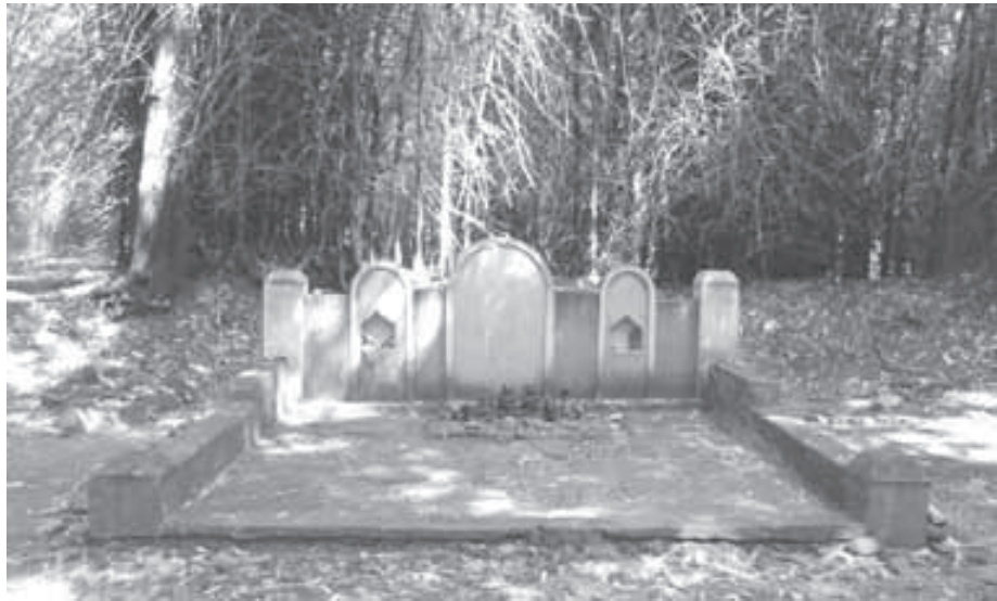
କୁମ୍ଭମୀ ଗ୍ରାମର ଧର୍ମୀୟ ବନ ମଧ୍ୟରେ ସିମେଣ୍ଟ କଂକ୍ରିଟର ନିର୍ମିତ ପିଣ୍ଡ

ଉପରୋକ୍ତ ୮ଗୋଟି କାରଣ ଯୋଗୁଁ ଧର୍ମୀୟ ବନ ନଷ୍ଟ ହେବାରେ ଲାଗିଛି । ଗୋଟିଏ ପଟେ ଉନ୍ନତିକରଣ ଯୋଜନା ଯଥା ସଡ଼କ ନିର୍ମାଣ କିମ୍ବା ପ୍ରଶସ୍ତୀକରଣ ଏକ ପ୍ରମୁଖ ସମସ୍ୟା ଭାବେ ଛିଡ଼ା ହୋଇଛି । ଏହା ଛଡ଼ା ଚୋରାରେ ପଥର ଚାଲାଣ, ଜବର ଦଖଲ ମଧ୍ୟ ଅନ୍ୟତମ କାରଣ ଅଟେ । ସହରୀକରଣ ହେବା ଦ୍ଵାରା ଗ୍ରାମର ସୀମା ବଢ଼ିବାରେ ଲାଗିଛି । ଜନସଂଖ୍ୟା ବୃଦ୍ଧି ମଧ୍ୟ ଏହାର ଅନ୍ୟ ଏକ କାରଣ । ଯେଉଁ ସ୍ଥାନରେ ଧର୍ମୀୟ ବନ ଅଛି, ସେଠାରେ କୌଣସି ଶିଳ୍ପ, ଖଣିଖାଦନ ହେଲେ ସେଠାରୁ ନିର୍ଗତ ହେଉଥିବା ପାଇଁଶମୁକ୍ତ ଧୂଆଁ, ଧୂଳିଗୁଣ୍ଡ ସବୁ ଉଡ଼ି ଆସି ସମ୍ପୂର୍ଣ୍ଣ ଧର୍ମୀୟ ବନରେ ପଡ଼ିବା ଫଳରେ ସାଭାବିକ ଭାବେ ପତ୍ର କଅଁଳିବା, ଫୁଲ ଧରିବା, ମଞ୍ଜିର ଅଛୁରଦଗମ ବା ଗଜା ହେବା ଆଦିରେ ବାଧାପୁଷ୍ଟି ହେବାର ଆଶଙ୍କା ରହୁଛି । ସେହିଭଳି, ମୃତ୍ତିକାକ୍ଷୟ ମଧ୍ୟ ଅନ୍ୟ ଏକ କାରଣ ଅଟେ । କାରଣ ପାହାଡ଼ର ପାଦଦେଶ ବା ଅନ୍ୟ ଭାଗରେ ଥିବା ପବିତ୍ର ବନଗୁଡ଼ିକରେ ବର୍ଷା ଦିନେ ବର୍ଷାଜଳ ପ୍ରବାହିତ ହେବା ଦ୍ଵାରା ପାହାଡ଼ର ମାଟି ଧୋଇହୋଇଯାଏ । ତେଣୁ ଏହାଦ୍ଵାରା ମାଟି ଧସିଯିବା, ଗର୍ଭ ସୃଷ୍ଟି