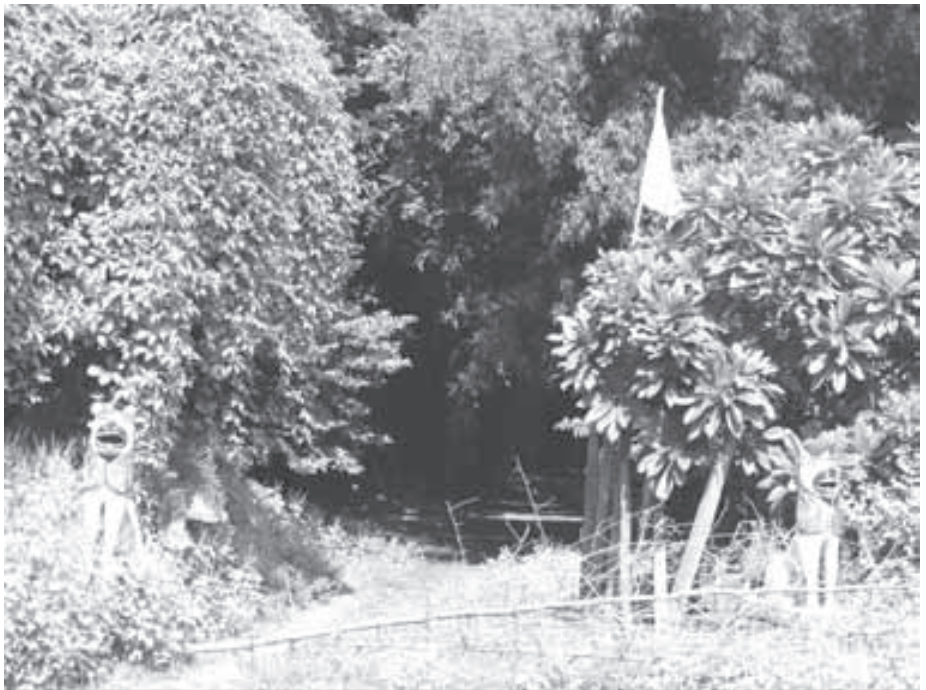
ନବରଙ୍ଗପୁର ଜିଲ୍ଲା ଝରିଗାଁ ବ୍ଲକ ଅଧୀନ କୁସୁମୀ ଗ୍ରାମର ଏକ ଧର୍ମୀୟ ବନର ପୃଷ୍ଠଶାଳା