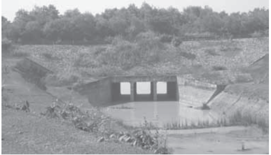
ରେଙ୍ଗାଲି କେନାଲ (ବ୍ରାହ୍ମଣୀଆ ଗ୍ରାମ) ନିକଟରେ ନିର୍ମାଣ କରାଯାଇଥିବା କୃତ୍ରିମ ହାତୀ ଚଲାପଥ