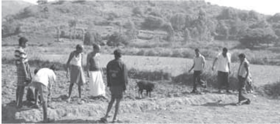
ଏକ ପାହାଡ଼ କିସମ ଜମି ଜଙ୍ଗଲ ଅଧିକାର କମିଟି ଦ୍ୱାରା ମପା ଯାଉଅଛି

କେନ୍ଦୁଝର ଜିଲ୍ଲାର ଭୂୟାଁ ଓ କୁଆଙ୍ଗ ପାଟୁ ଅଞ୍ଚଳର ସର୍ବେକ୍ଷଣ ଓ ବନ୍ଦୋବସ୍ତ ପାଇଁ ଯେଉଁ ନିୟମାବଳୀ ଓଡ଼ିଶା ସରକାର ପ୍ରଣୟନ କରିଥିଲେ, ସେଥିରେ ନିର୍ଦ୍ଦେଶ ଥିଲା ଯେ ପାହାଡ଼ର ‘ଉପର ଭାଗ’କୁ ଜଙ୍ଗଲ ପାଇଁ ଓ ‘ତଳ ଭାଗ’କୁ ଗୋବର ପାଇଁ ରଖାଯିବ। ଏ ଦୃଷ୍ଟିରୁ ଦେଖିଲେ ପାହାଡ଼ ସହିତ ଜଙ୍ଗଲକୁ ଆଇନତଃ ଯୋଡ଼ି ହେବ। କିନ୍ତୁ ସମୟ କ୍ରମେ ବ୍ୟବସ୍ଥା ହୁଏତ ବଦଳୁଛି, କିମ୍ବା ପୂର୍ବ ବ୍ୟବସ୍ଥା ପ୍ରତି ଧ୍ୟାନ ରହୁନାହିଁ। ସେ ଯାହା ହେଉ, ବ୍ୟବସ୍ଥା ଯଦି ଶେଷ ପର୍ଯ୍ୟନ୍ତ ଲୋକଙ୍କର ନ୍ୟାୟ ଅଧିକାରକୁ ସୁରକ୍ଷିତ କରିପାରେ, ତା’ ହେଲେ ଲକ୍ଷ୍ୟ ସିଦ୍ଧ ହେବ।