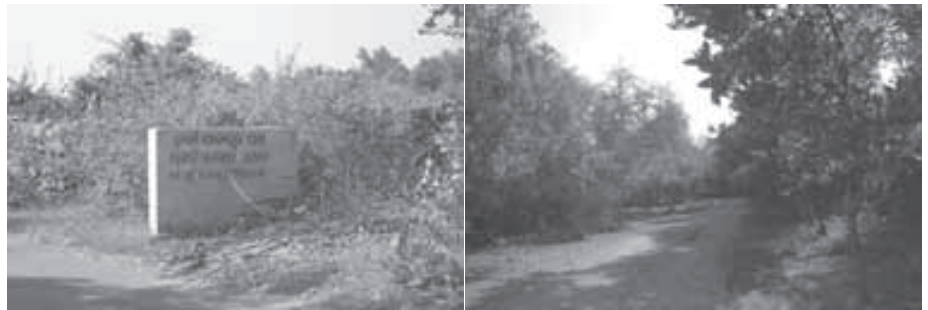
ରେଙ୍ଗାଲି କେନାଲ ଠାରେ ନିର୍ମିତ ହାତୀ ଚଲାପଥର ବୋର୍ଡ