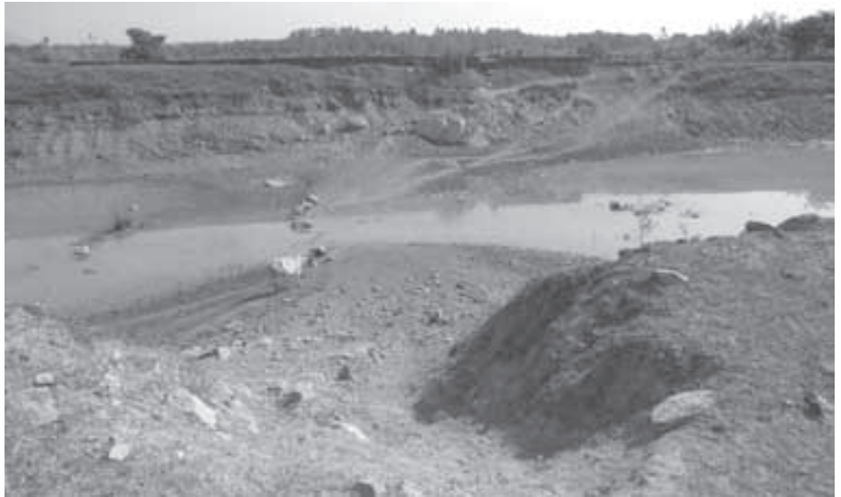
ଠାକୁରାଣୀ ହୁଣ୍ଡି ଠାରେ ଥିବା ହାତୀର ପ୍ରକୃତ ପାରମ୍ପରିକ ଚଲାପଥ, ଯାହା କୃତ୍ରିମ ଚଲାପଥ ଠାରୁ ପ୍ରାୟ ୬୦୦ ମିଟର ଦୂରରେ ଅବସ୍ଥିତ